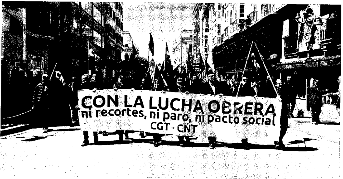
Manifestación del 1º de Mayo de 2018 en Burgos.

Los tiempos no cambian. La explotación laboral sigue vigente. Las libertades públicas se ven amenazadas con el auge de ideologías totalitarias y con las leyes regresivas de los últimos gobiernos. La mitad de la población sigue marginada y sufriendo la intolerable lacra de la violencia machista. Se niega la existencia del cambio climático y se propicia por los mercados la sobreexplotación del planeta. No, los tiempos no han cambiado tanto.